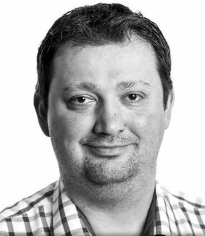
Anton Piribauer • Weingut & Heuriger Piribauer