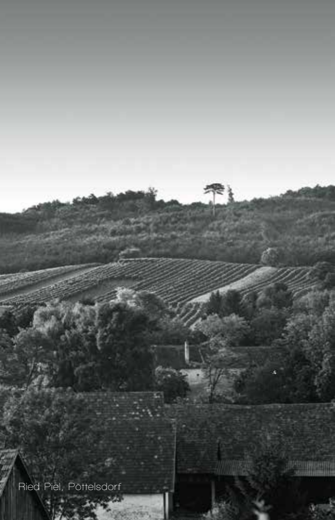
Ried Piel, Pöttelsdorf